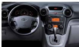
S8 - Montana Grey 1) :