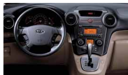
RU - Coral Beige 1) :