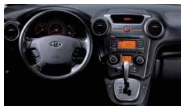
WK - Saturn Black: