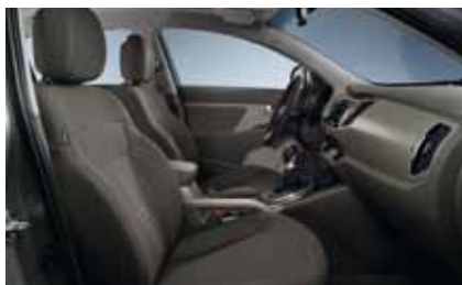
Motion + Active: GAH - Alpine Grey / Stoff