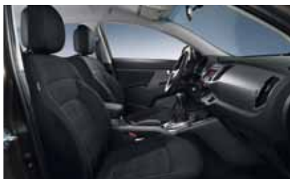
Cool: WK - Schwarz / Stoff