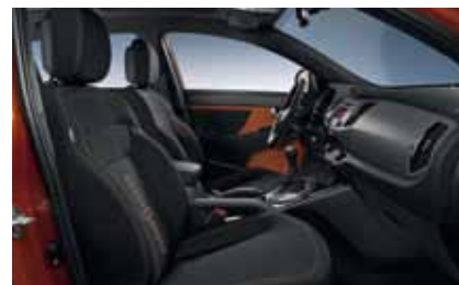
Motion + Active: WK - "Sunrise Orange" / Stoff