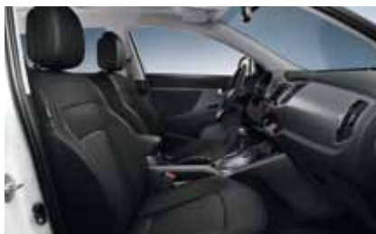
Active Pro: WK - Schwarz / Leder