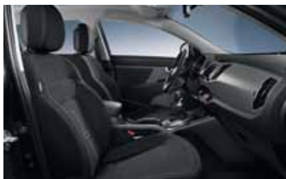
Motion + Active: WK - Schwarz / Stoff