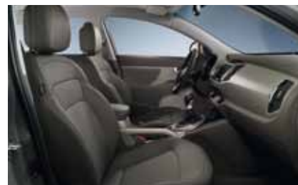
Active Pro: GAH - Premium Grey / Leder