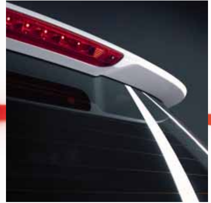
Heckspoiler mit integrierter Bremsleuchte