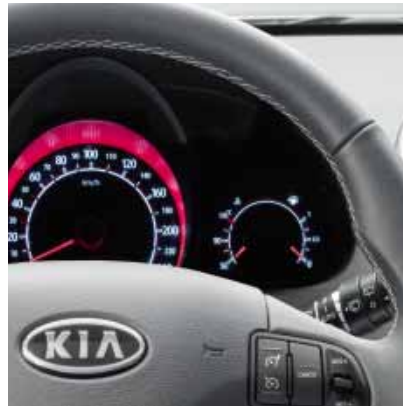
Lederlenkrad mit grauen Nähten