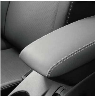
Lederarmlehne mit grauen Nähten