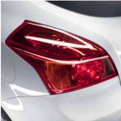
Hoch positionierte, plastisch geformte Rückleuchten

Im Straßenbild sticht der Kia pro_cee'd sofort ins Auge. Ausgeprägte Überhänge vorne und hinten geben ihm seinen auffallenden Coupé-Charakter, die langen Türen unterstreichen das dynamische, keilförmige Profil. Hinzu kommen je nach Variante markante Details wie der flache Kühlergrill, der breite Frontstoßfänger mit Spoiler, die schwarz eingefassten Scheinwerfer, die fünfspichtigen 17-Zoll-Leichtmetallfelgen und das groß dimensionierte Edelstahl-Endrohr.