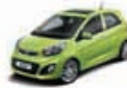
Lemon Grass (L7G) 2)