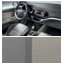
GAH - "Premium Grey" / Stoff + Kunstleder 1)