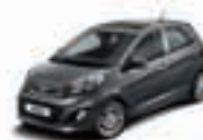
Galaxy Black (Z1) 2)