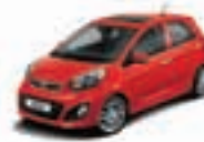
Signal Red (BEG) 2)