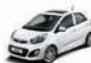
Clear White (UD) 1)