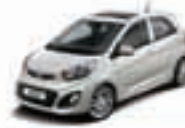
Milky Beige (M9V) 2)