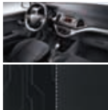
EQ - Schwarz / Stoff