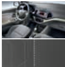
GAH - "Urban Grey" / Stoff 1)