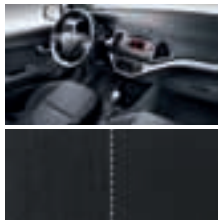
EQ - Schwarz / Stoff