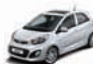
Bright Silver (3D) 2)