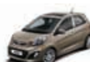
Cafe Mocha (C5M) 2)