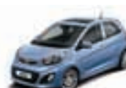
Alice Blue (ABB) 1)