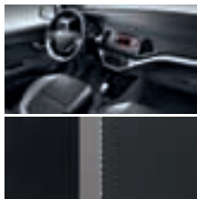
EQ - schwarz / Stoff + Kunstleder