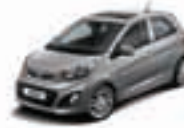
Titanium Silver (IM) 2)