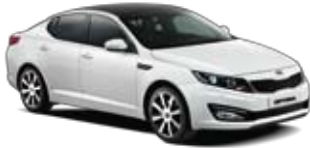
Snow White Pearl [SWP] 2