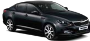
Ebony Black [EB] 1

Symbolfotos 1 Solid 2 Mica-/Metallic-/Mehrschichtlackierung * verfügbar lt. Lager Kia Austria. Die abgebildeten Farben können vom Originalton abweichen.