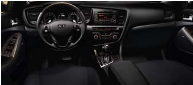
Motion: Schwarz, Stoff (VA)