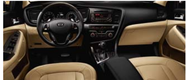
Motion: Beige, Stoff (UP)