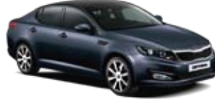
Platinum Graphite [ABT] 2