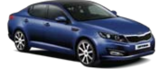
Santorini Blue [HO] 2