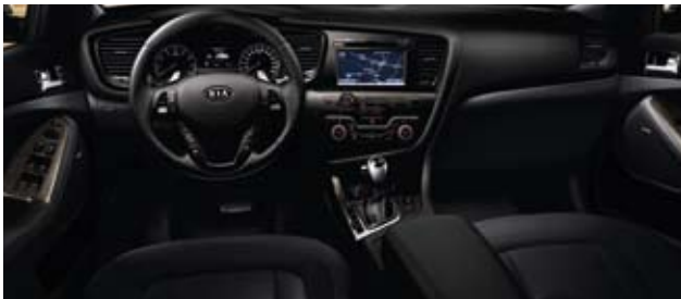
Active: Schwarz, Teilleder (VA) mit Sportsitzen