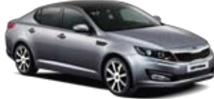
Light Graphite [LC] 2