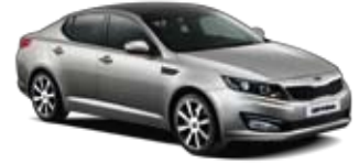
Satin Metal [STM] 2