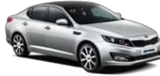
Bright Silver [3D] 2